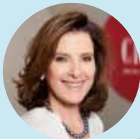
Romy Faisst Business Circle